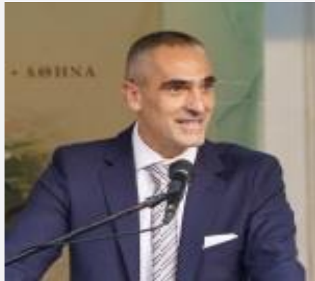
Καθ. Θωμάς Μπαρτζάνας Επιστημονικός Υπεύθυνος